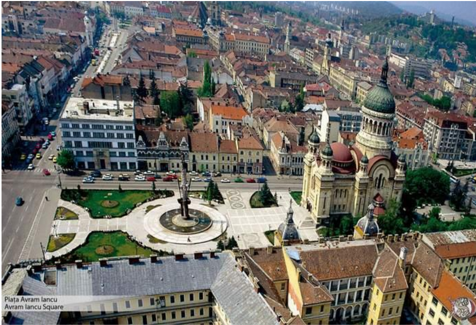
Piața Avram Iancu Avram Iancu Square