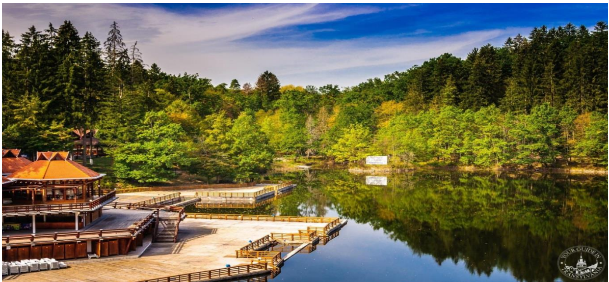
Lacul Ursu (Sovata)