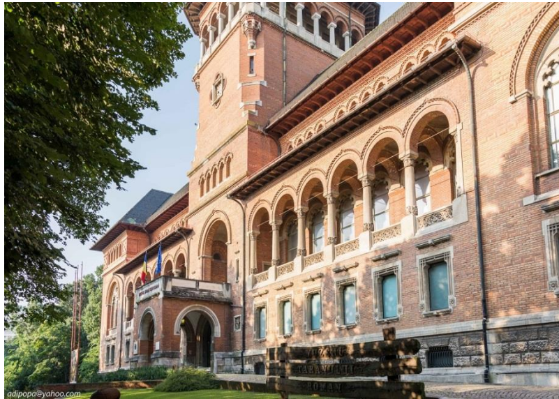
Muzeul Țăranului Român