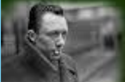
Albert Camus French Nobel Prize winning author

A MAN WITHOUT ETHICS IS A WILD BEAST LOOSED UPON THIS WORLD.